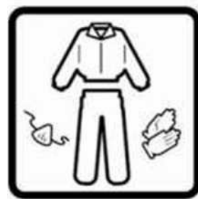
Katta kinni paljas nahk. Mitteventileeritavates piirkondades töötamisel kanda ühekordselt kasutatavat näomaski.