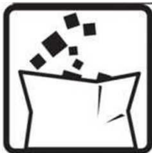
Jäätmed tuleb kõrvaldada kohalike eeskirjade järgi.