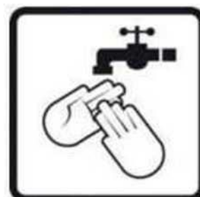
Enne pesemist loputada külma veega.