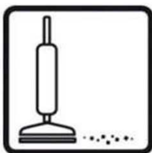
Puhastada piirkond tolmuimejaga. Peast kõrgemal tehtavate tööde korral kanda kaitseprille.